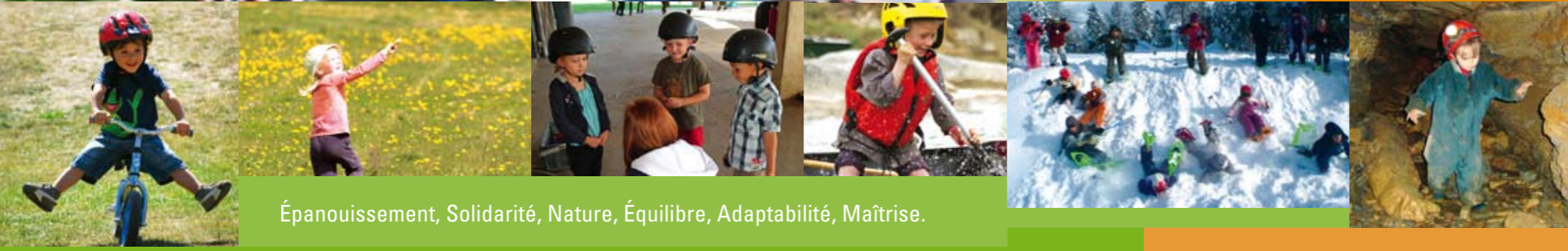
Épanouissement, Solidarité, Nature, Équilibre, Adaptabilité, Maîtrise.